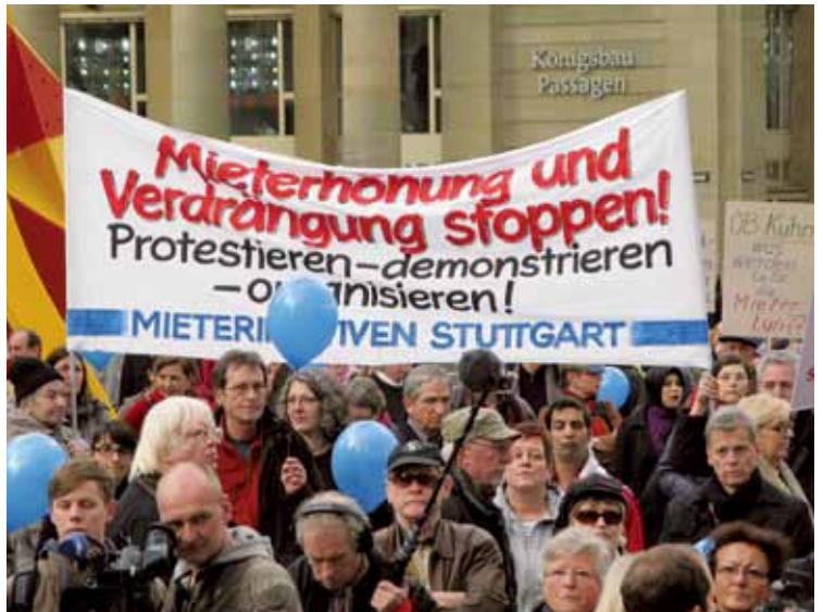
Hohe Mieten treiben in Deutschland die Leute auf die Strasse.

Auch in Stuttgart, der Landeshauptstadt von Baden-Württemberg, explodieren die Mieten. Laut dem jüngsten Mietspiegel sind die Neuvertragsmieten im Altbau um elf Prozent und im Neubau um 13,5 Prozent gestiegen. Der Anstieg im Wohnungsbestand beträgt sechs Prozent, mehr als doppelt so hoch wie die allgemeinen Lebenshaltungskosten. Als «völlig unzumutbar» bezeichnet der Mieterverein die Preissteigerungen bei energetischen Sanierungen. Laut Gesetzeslage kann der Vermieter 11 Prozent der Moder-