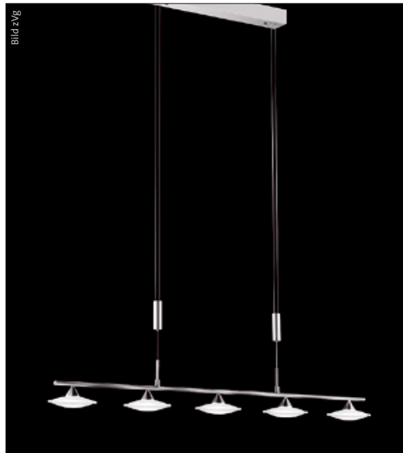
Wie sparsam sind LED-Wohnleuchten wirklich?

Getestet wurden auch achtzehn LED-Spots. Nur ein Drittel erfüllte die Topten-Anforderungen. Die beste Energieeffizienz erreichten drei Ledino-Produkte von Philips. Sie bringen es mit 16 und 17 Watt auf eine