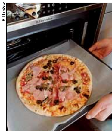
Fertigpizzen aus dem Supermarkt brauchen viel Energie.

Das zweite Aha-Erlebnis: Der Verzicht aufs Vorheizen des Backofens brachte eine Stromeinsparung von lediglich fünf bis acht Prozent. Dieser kleine Spareffekt kann jedoch schnell zunichte gemacht sein. Ohne Vorheizen ist es nämlich schwieriger zu beurteilen, wann die Pizza fertiggebacken ist. Das kann dazu führen, dass der Backofen länger eingeschaltet bleibt, als wirklich nö-