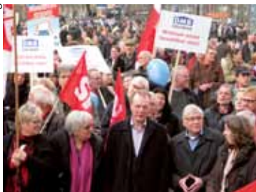
Wenige wurden erwartet, viele kamen: Erfolgreiche Mieterdemo in Stuttgart.

Stuttgart ist nur ein weiteres Glied in der Kette von wohnpolitischen Demonstrationen in deutschen Städten. Seit letzten Herbst gab es in praktisch allen grösseren Orten Protestaufmärsche gegen Spekulation, überrissene Mieten und Wohnungsknappheit (es stand in M&W). Die drückenden Wohnkosten stellen sich als ein immer grösseres Problem heraus. In Stuttgart bezahlen die Mieterinnen und Mieter laut einer neuen Studie im Schnitt bereits 42 Prozent ihres Einkommens für die Wohnkosten. Das ist im Vergleich zur Schweiz sehr hoch, wo mit einer Quote von 25 Prozent gerechnet wird.