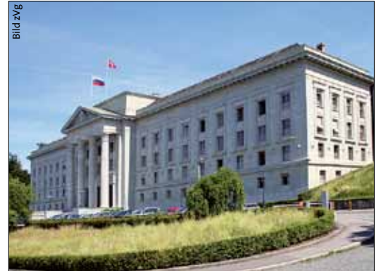
Das höchste Gericht in Lausanne

Für das Bundesgericht stand damit die Missbräuchlichkeit fest. Allerdings konnte der nach orts- und quartierüblichem Niveau zulässige