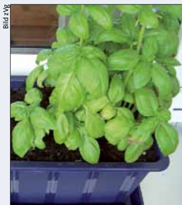
Basilikum wächst überall.

Gärtnern auf wenigen Quadratmetern ist keine Kunst. Wer Infos dazu sucht, wird im Internet schnell fündig. Die Ratgeberliteratur wächst rasant, schneller als jeder Setzling. Gerade jetzt in den ersten Frühlingswochen sind die Regale