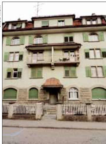
Eine Liegenschaft, die im Besitz der gemeinnützigen Stiftung ist.

Das erste Aha-Erlebnis: Ob Kühl- oder Tiefkühlpizza spielt für den Stromverbrauch keine entscheidende Rolle. Wir haben den Backofen mit Ober- und Unterhitze gemäss Anleitung auf jeweils 220 Grad auf-