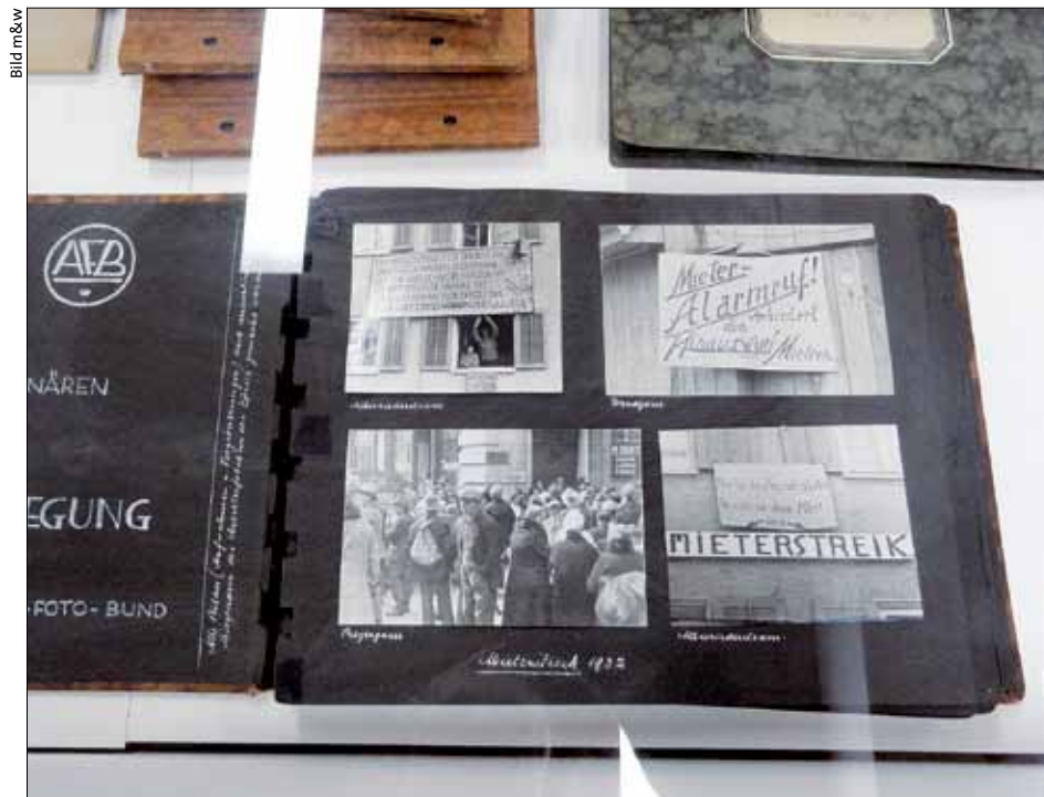
In der Ausstellung «Gretlers Panoptikum» in St.Gallen sind zeitgenössische Fotos des Mieterstreiks von 1932 in Zürich zu sehen.

Die Idee, keine Miete mehr zu zahlen, wuchs auf dem Boden der wirtschaftlichen Notlage: Hohe Arbeitslosigkeit und Lohnabbau trafen auf steigende Mietzinsen und Lebens-