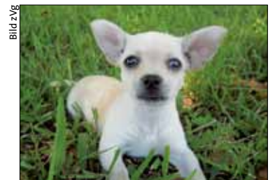
Mögen Vermieter Hunde nicht?

Ein generelles Verbot von Hunden und Katzen sei unwirksam, entschieden die Richter. Ihre Begründung: «Das Verbot benachteiligt den Mieter unangemessen, weil es ihm die Hunde- und Katzenhaltung ausnahmslos und ohne Rücksicht auf besondere Fallgestaltungen und Interessenslagen verbietet.» Andererseits dürfe ein Mieter auch nicht Hunde oder Katzen ohne jegliche