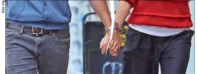
Manche Partnerschaft hält nicht so lange wie gedacht.

Möglichkeit, denn sie ist aufwendig, kostet etwas und dauert einige Zeit. In Wirklichkeit bleibt somit nur eins: im Gespräch eine Lösung finden. Damit hinterlässt die schmerzliche Trennung auch weniger bittere Gefühle.