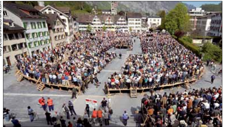
Unter offenem Himmel wird im Glarnerland über das Mietrecht abgestimmt.

Diese gegnerischen Argumente sind leicht zu widerlegen. Die Befürchtung vor einer Verfahrenslawi-