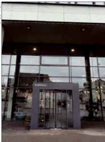
Stadthaus Dübendorf: Wann kommt die Wende in der Wohnpolitik?