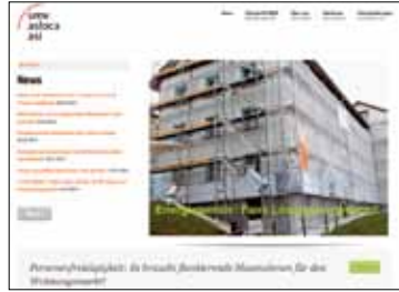
Gut im Bild mit www.smv-asloca-asi.ch

«Auf unserer Webseite stehen die politischen Geschäfte im Vordergrund, mit denen wir uns beschäfti-