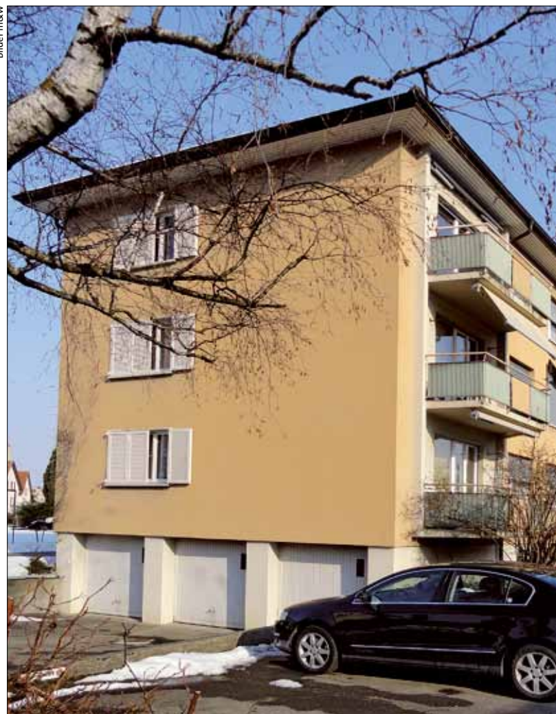
In diesem Mehrfamilienhaus in St.Margrethen endete im letzten Januar ein Streit unter N

Schoch hat als Mediator schon manche Streitfälle betreut, oft mit Erfolg. In einem Fall lagen sich zwei Parteien in einem Wohnhaus in den Haaren, in dem auch die Vermieterin wohnte. Streitpunkt war der Lärm zu Unzeiten, aber auch Kinder, die manchmal etwas laut waren. Die