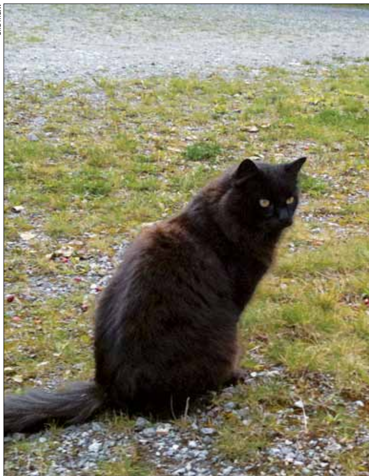
Er jagt gerne Vögel – sind es gar zu viele?